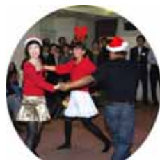
プロも顔負けのすばらしいダンス。覚えるのが大変でしたね