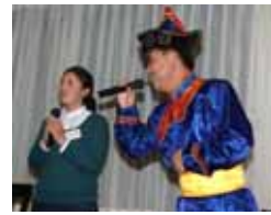
モンゴルの馬頭琴と歌。草原の中から聞こえてくるよう。