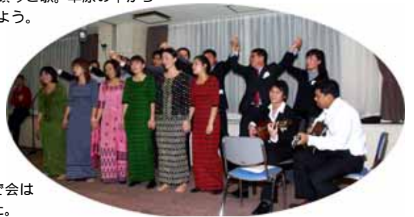
会館生によるミャンマーの踊り。そして「ベストフレンド」をみんなで合唱。女の子達のミャンマーの衣装、みんなきれいでしたよ。